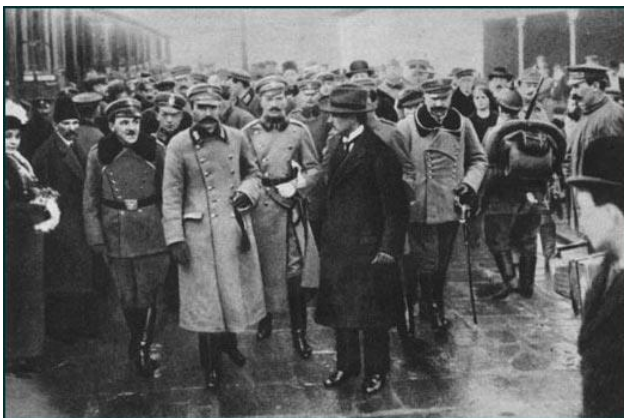
Powitanie Komendanta na dworcu kolejowym w Warszawie 11 listopada 1918 r.

10 listopada - powrócił do Warszawy Józef Piłsudski, komendant I Brygady Legionów, internowany od lipca 1917 r. przez Niemców w Magdeburgu.