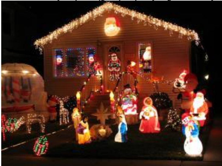
Świąteczny wystrój hiszpańskiego domu.