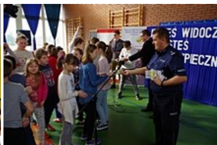
Odblaski dla każdego