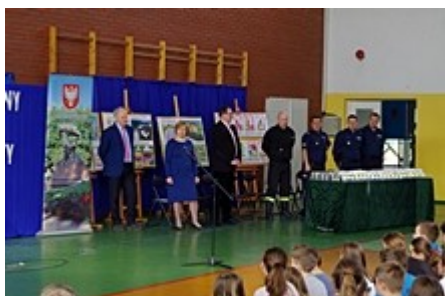
Z zaproszonymi gośćmi

Uczniowie obejrzelik także film na temat zagrożeń związanych z pieszymi w ruchu drogowym – „Tak, chcę być bezpieczny...” połączony z prelekcją przedstawiciela Policji. Dodatkową atrakcją dla uczniów była możliwość przejażdżki na symulatorze jazdy motocyklem. Każdy z ponad 180 uczniów otrzymał w prezencie zestaw elementów odblaskowych. Jednym z celów akcji edukacyjnej jest przekonanie wszystkich, że noszenie odblasków ma sens i może uratować coś, co jest najcenniejsze – życie.